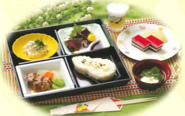
特養老人ホーム食事紹介