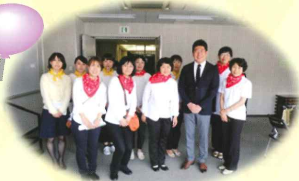
市長と川崎食支援交流会有志