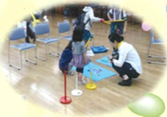
ゲームキッズコーナー