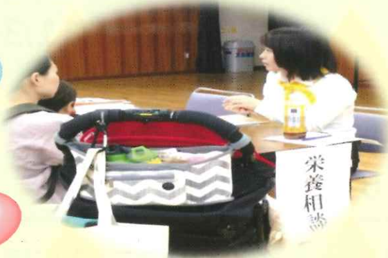
栄養相談コーナー